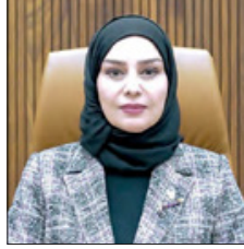
رئيس مجلس النواب